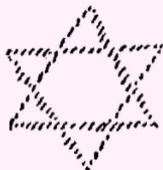
Zweiter Logos Makrokosmos