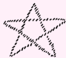
Dritter Logos Mikrokosmos